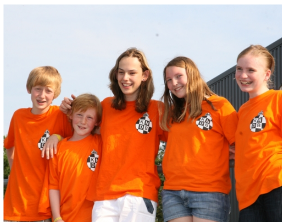
Jóvenes jugadores de damas del Equipo Holandés, participantes en el Campeonato Europeo en el 2009 en Beilen (Holanda)